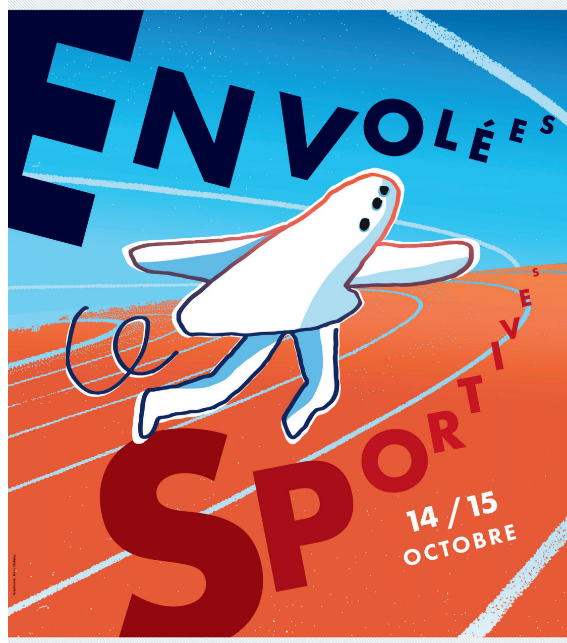
Illustration: Marie Perle